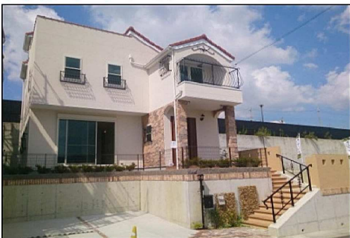
※現在モデルハウスの販売はしていません。