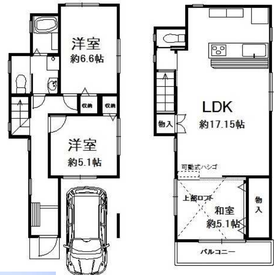
※カーナビ:神戸市垂水区千鳥が丘3丁目23-15周辺